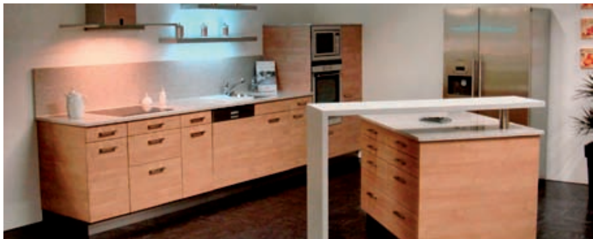
«Unsere Zusammenarbeit mit den Alpnach-Küchen, die in Niederwangen einen Ausstellungsraum haben, hat sich bestens bewährt und bringt viele Vorteile: Zum Beispiel beste Qualität bei einem top Preis-Leistungsverhältnis.»